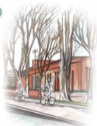
Facultad de Farmacia

Hasta hace unos pocos años se consideraban la misma especie y en cuanto a su aspecto físico se refiere, el mosquitero común y el mosquitero ibérico son prácticamente idénticos. No obstante, presentan rasgos migratorios muy diferentes y sus cantos son distintos. El mosquitero ibérico inverna en África subsahariana y migra a la península ibérica en la primavera mientras que el mosquitero común inverna en península ibérica y cría mayormente en el norte de Europa.