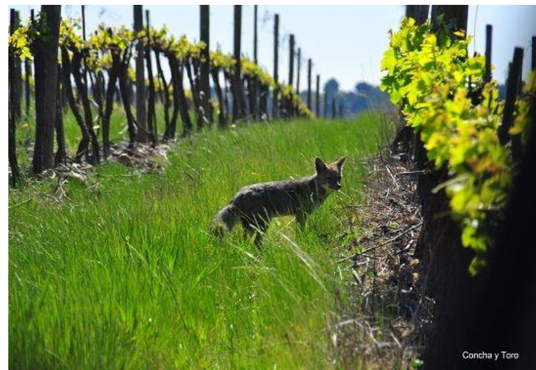
Concha y Toro